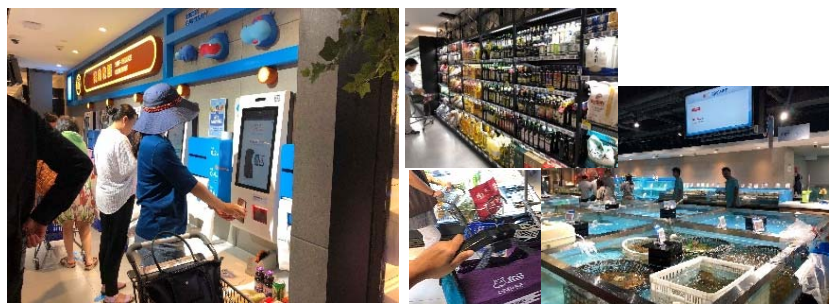
上海のスーパーマーケット